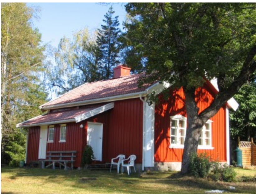
Skolestue, Østfold. Foreslått fredet av privatperson 2012.

Det er fredet noen grunnskolebygg fra det tidlige 1900-tallet i de store byene. Noen skolestuer er ivarettatt av lokale museer. (Se ellers kommunal/ fylkeskommunal sektor 6.14)