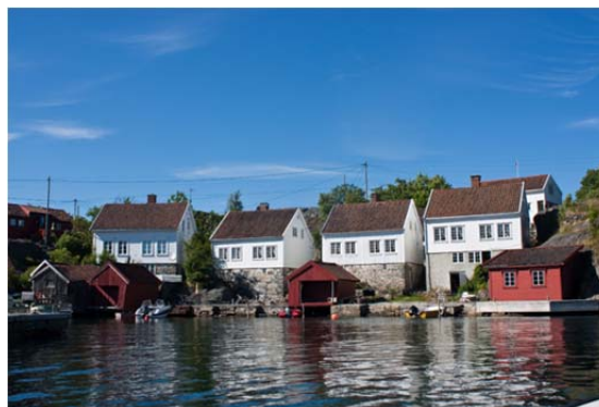
Småskala bolig/ sjømenn

Videre ser vi et behov for å ta tak i temaet « Grøntanlegg ». Her er det behov for å sikre de sentrale hagehistoriske verkene, men også vesentlig å inkludere grønntanlegg i nye fredninger av boliger/ boliganlegg.