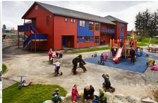
Espira Sletten barnehage