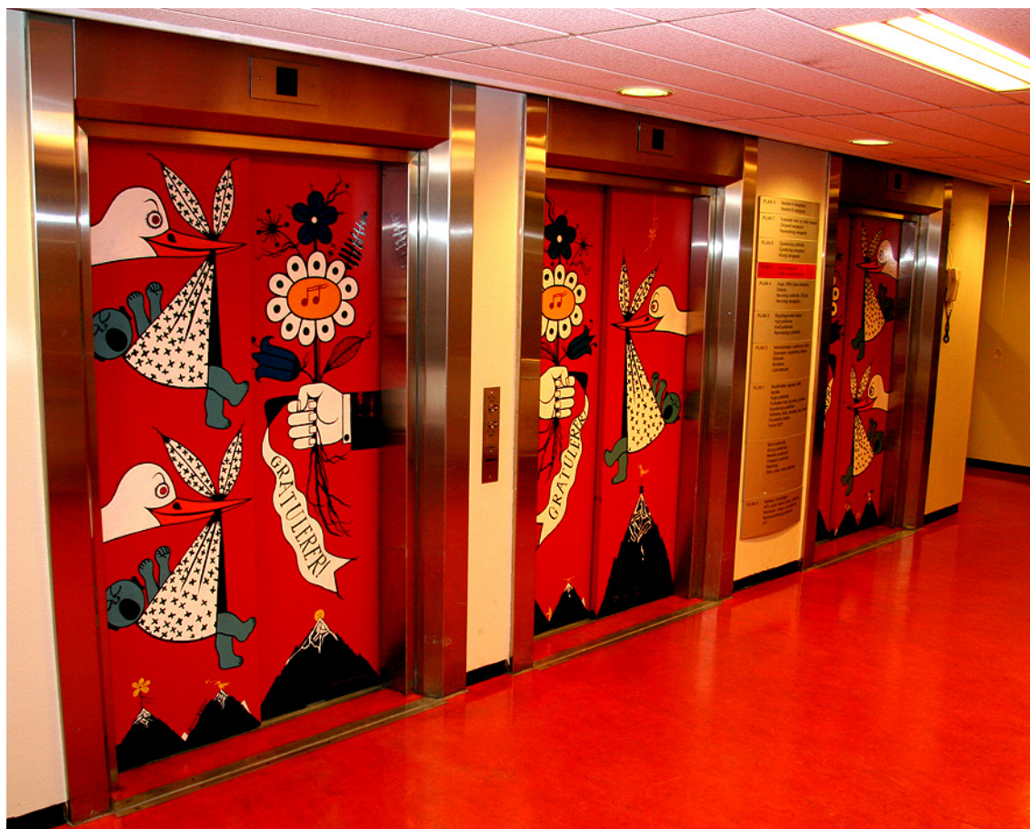
Heisparti til fødeavdelingen: Førde sentralsjukehus er fra 1979 er et av mange anlegg fredet gjennom de statlige landsverneplanene.

For enkelte temaer ser Riksantikvaren behovet for en mer systematisk tilnærming til utvelgelse av fredningsobjekter. Vi har de siste årene arbeidet mye med verneplan som metode og ser at dette er en god måte å gjennomføre fredninger på. For noen få utvalgte tema vil det være aktuelt å bruke verneplan som metode. Innenfor andre av de prioriterte temaene vil antall fredninger være så begrenset at utarbeidelse av en verneplan ikke vil være hensiktsmessig.