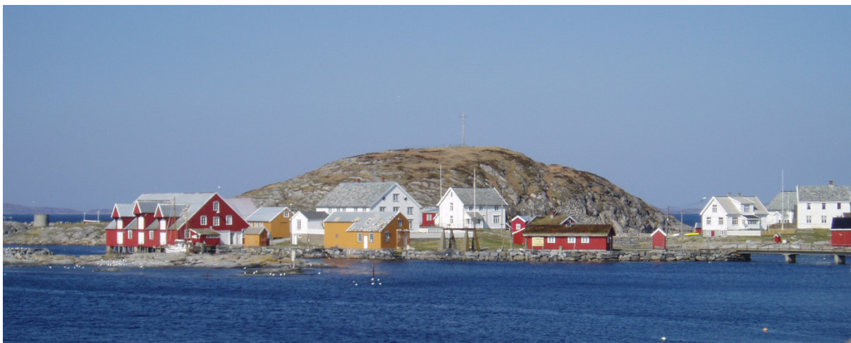
Sør-Gjæslingan i Nord-Trøndelag: Kulturmiljøet ble fredet i 2010 for å ta vare på det særegne fiskeværet som kilde til kunnskap og opplevelse for dagens og framtidens generasjoner.