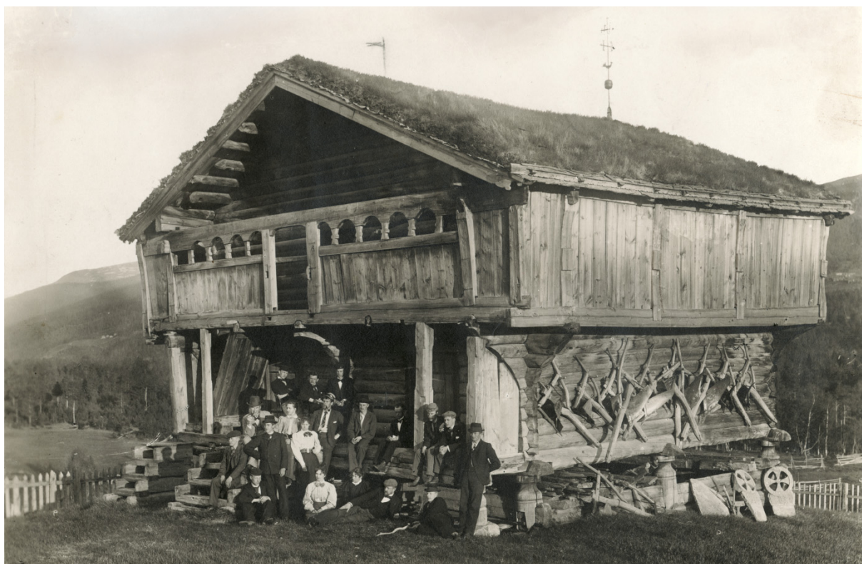
Fredet etter bygningsfredningsloven: Bjølstad i Sel kommune ble fredet i 1924. De mange bygningene på Bjølstad var blant de første som ble målt opp av antikvarer.

Loven baserte seg i hovedtrekk på den tilsvarende danske loven, som ble vedtatt i 1918. Loven gjaldt bare verdslige bygninger, og kriteriet for å frede bygninger, eller deler (luter) av bygninger, var at disse måtte være over 100 år og ha spesiell kunstnerisk eller historisk verdi. I særlige tilfeller kunne også yngre bygninger, eller bygninger med spesiell betydning for lokalhistorien, fredes.