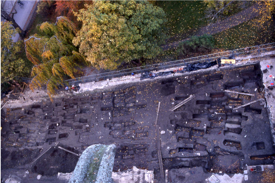
Utgraving ved Nidarosdomen i forbindelse med nytt servicebygg: Til høyre i bildet er graver som ble flyttet ut av krypten og gjenbegravd på midten av 1800-tallet. Disse er stort sett fra 1700-tallet. Til venstre er fattigkirkegården, som var i bruk rundt århundreskiftet 17-1800.

med metode- og kriterieutvikling. Dette vil være et satsingsfelt fremover.