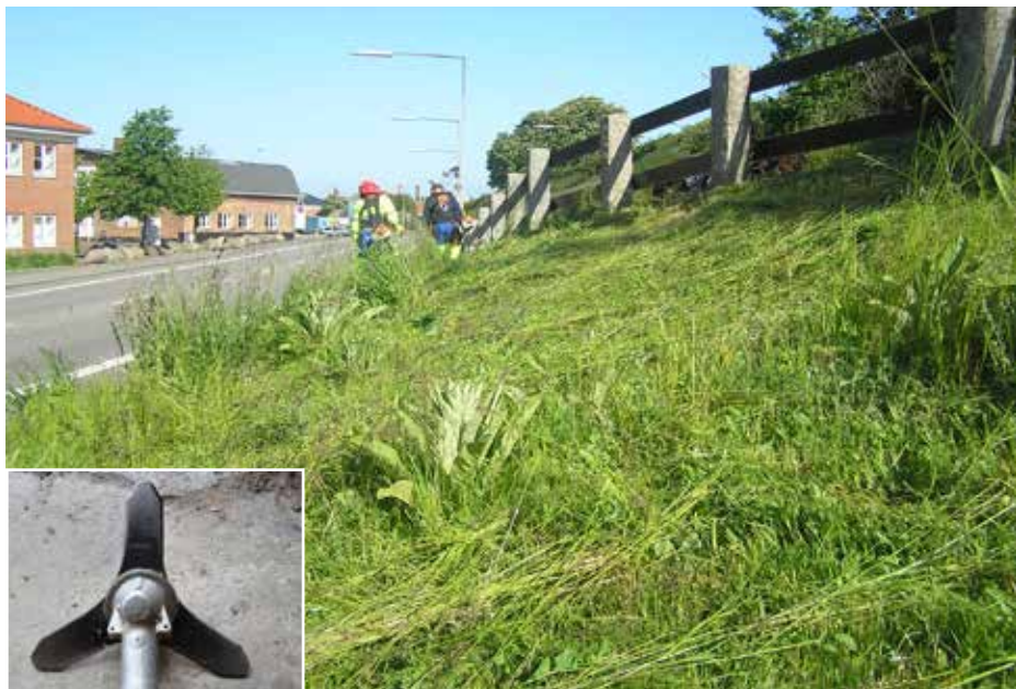
Trekantsklinge på kratrydder. Den slår på samme måde, som når man anvender en le.

Det er ofte vigtigt, at høet fjernes, så vegetationen udpines, hvilket giver de næringskrævende arter dårligere betingelser, og spinklere planter får bedre forhold. Dette gøres af hensyn til den mindre næringskrævende del af floraen og ikke af hensyn til reliktpanterne, som i det store og hele er næringskrævende arter.