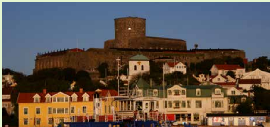
Kirken på klosterområdet ligger midt i byen lige uden for Carlstens fæstning.