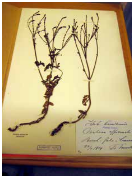
Herbarieark med jernurt ( Verbena officinalis ).

En anden måde at undersøge en mulig kulturreliktplante på er at undersøge dens DNA for at se, om den adskiller sig fra moderne planter og fra dem, som findes i handelen i dag. Hvilke andre typer ligner den mest? Hvis den mest ligner typer, som vokser et andet sted i Europa, kan den måske være kommet derfra.