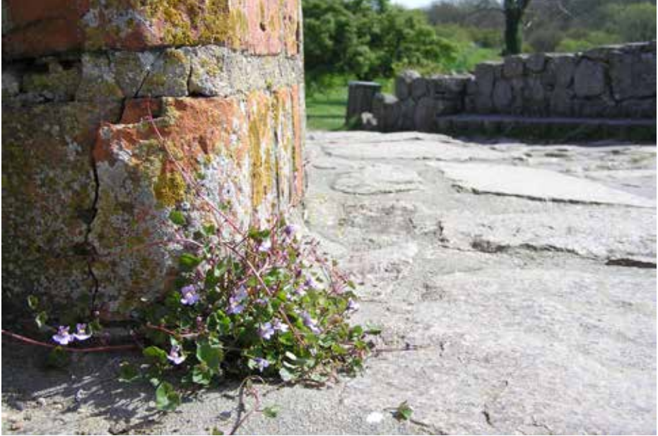
Urteagtige planter gør ingen skade på murværket. Øverst en vedbend-torskemund ( Cymbalaria muralis ), nederst til venstre en gul lærkespore ( Pseudofumaria lutea ). Nederst til højre svaleurt ( Chelidonium majus ), foto Per Arvid Åsen.