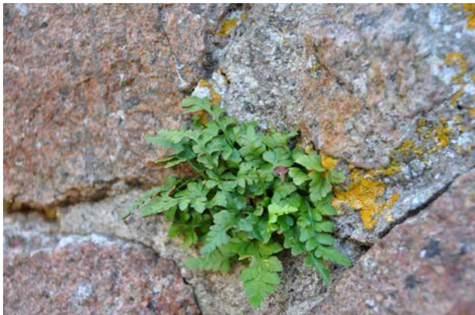
Sort radeløv ( Asplenium adiantum-nigrum ) er en sjælden bregne, som findes i fugtige skovkløfter nær havet. Her sidder den i en af murene på Hammershus.

I Norden findes flere bregnearter, der er rødlistede, og som vokser på gammelt murværk og stengærder, f.eks. sort radeløv ( Asplenium adiantum-nigrum ) på Hammershus. Hvis der er truede arter i murværket, bør man vurdere, om der kan restaureres uden om planten.