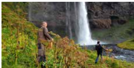
NordGen samler frø af kvan ( Angelica archangelica ) på Island.

Men selv med en fornuftig pleje kan der hænde ting, som man ikke kan tage højde for. F.eks. kan en rigtig hård vinter skade nogle planter. Som en ekstra sikkerhed kan truede arter og specielle bestande derfor bevares ved at indsamle frø, som gemmes i genbanker.