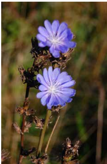
Cikorie ( Cichorium intybus ). Alnarp, Sverige.

Det er også vigtigt at huske på, at en plante kan være almindelig i en del af Norden, men ualmindelig og indført i en anden del. Det hændte, at man tog planter med sig, når man flyttede f.eks. mellem Norge og Færøerne, og de kan have vokset isoleret på de nye steder siden da. Eksempler på sådanne arter er rejnfan ( Tanacetum vulgare ) og kommen ( Carum carvi ).