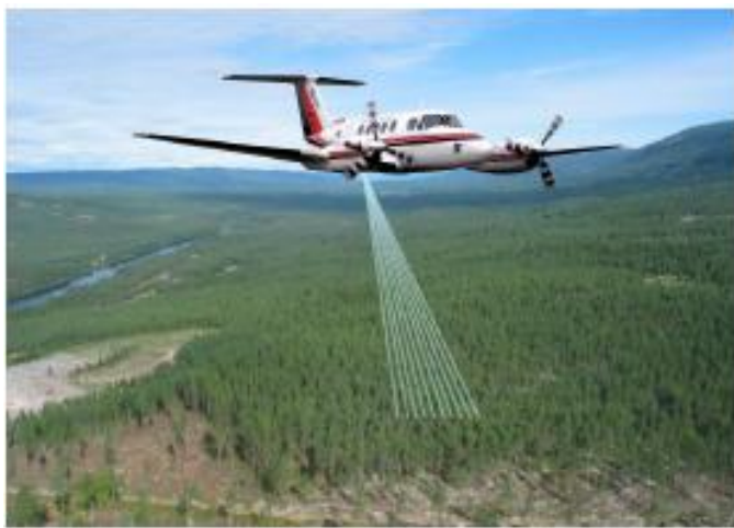
Kubikkmassen blir målt svært nøyaktig ved hjelp av flybåren laser.

Det skal brukes en arealbasert lasertakst for å beregne tømmervolumet. Metodikken gir et avvik på inntil 10 % av stående kubikkmasse for \frac{2}{3} av bestandene.